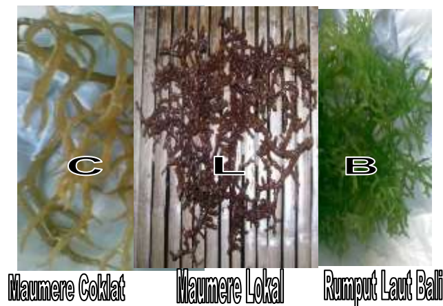
Gambar 2. Varietas Rumput Laut Yang Digunakan Sebagai Perlakuan

Penelitian ini dirancang dengan menggunakan rancangan percobaan pola faktorial, yang terdiri dari dua faktor yaitu varietas dan kedalaman. Masing-masing faktor terdiri atas 3 taraf sehingga terdapat 9 kombinasi perlakuan dan setiap kombinasi perlakuan diberi 3 ulangan, sehingga terdapat 27 unit percobaan.