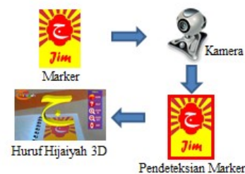
Gambar 1. Sistem Pada Metode Marker Based Tracking

Adapun rancangan sistem untuk metode marker based tracking dan metode markerless tersaji pada Gambar 1 dan 2,