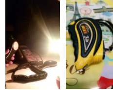
Gambar 4. Alat Pengukur Intensitas Cahaya dan Jarak

Adapun lux meter dan juga meteran yang digunakan dalam proses pengujian tersaji pada Gambar 4.