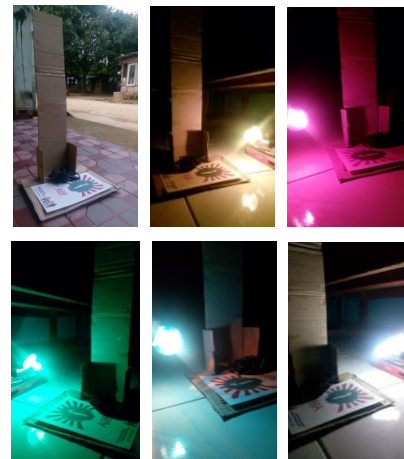
Gambar 3. Ilustrasi Pengujian

Berikut ini adalah persiapan sebelum melakukan pengujian yang tersaji pada Gambar 3.