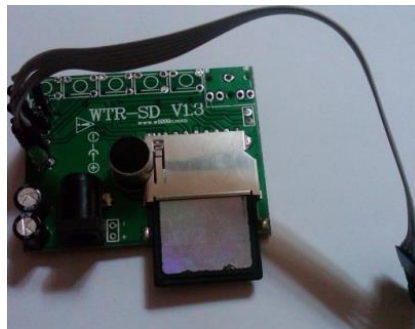
Gambar 1. Modul perekaman suara WTR010