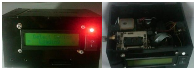
Gambar 2. Tata letak rangkaian elektronik dan box

Desain rangkaian PCB layout dan tempat kotak ( box ) yang dibuat agar mudah dalam perbaikan maupun pengoperasian. Peletakan dengan menggunakan konsep bentuk tumpukan ( stacking ) pada modul rangkaian sehingga lebih sederhana dan mudah untuk perakitan sistem perekam suara, unit kendali, modul GSM dan modul GPS. Dengan metode stacking akan membuat dimensi bisa lebih ramping.