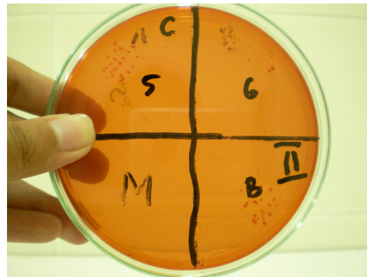
Gambar 4. Hasil percobaan II Escherichia coli dengan serial dilusi 50% (1), 25% (2), 12,5% (3), 6,25% (4), 3,13% (5), 1,56% (6), kontrol media dan kontrol bakteri

Dari keseluruhan hasil KHM dan KBM dapat diringkas sebagai berikut :