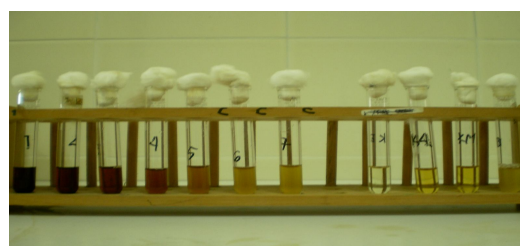
Gambar 1. Hasil percobaan ke V untuk Staphylococcus aureus dengan serial dilusi 50%, 25%, 12,5%, 6,25%, 3,13%, 1,56% dan 0,78% serta kontrol ekstrak, kontrol media, kontrol antibiotik dan kontrol bakteri

Percobaan dilakukan dengan 5 kali pengulangan untuk masing-masing bakteri, yaitu bakteri gram positif ( Staphylococcus aureus ATCC 25923) dan bakteri gram negatif ( Escherichia coli ATCC 35218). Konsentrasi ekstrak setelah ditambah suspensi bakteri menjadi 50%, 25%, 12,5%, 6,25%, 3,13%, 1,56 % dan 0,78%.