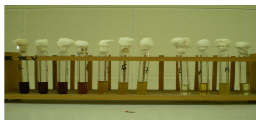
Gambar 2. Hasil percobaan V untuk Escherichia coli dengan serial dilusi 50%, 25%, 12,5%, 6,25%, 3,13%, 1,56% dan 0,78%. Kontrol ekstrak, kontrol media, kontrol bakteri dan kontrol antibiotik

Selanjutnya untuk mengetahui KBMnya dilakukan kultur pada media agar darah untuk Staphylococcus aureus dan pada Mc Conkey untuk Escherichia coli . Hasil dapat dilihat pada gambar 3 dan 4 serta tabel 1 dan 2.