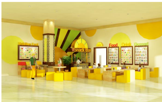
Gambar 12. Area snack bar Montessori School

Kantin pada sekolah ini dibagi menjadi beberapa area. Area utama adalah area serving dimana para siswa akan menerima jatah makanan yang telah disediakan ketika jam istirahat. Di daerah area serving juga terdapat beberapa meja dan kursi makan yang didesain moveable mengingat area serving juga digunakan sebagai tempat kegiatan belajar memasak oleh para siswa untuk waktu tertentu.