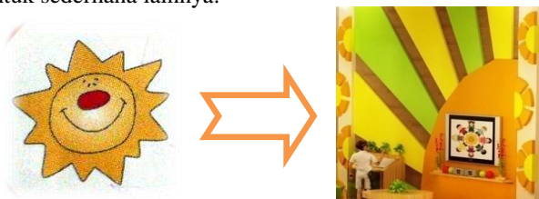
Gambar 1. Stilasi logo Montessori

Elemen dekoratif yang ada menggunakan stilasi dari logo sekolah Montessori itu sendiri. Sekolah Montessori memiliki logo matahari yang melambangkan sinar terang dimana terdapat sebuah gambaran figur wajah dalam gambar tersebut. Suasana hangat dan ceria yang ada di dalam sekolah ini digambarkan dengan figur matahari yang tersenyum. Oleh karena itu beberapa elemen dekoratif menggunakan stilasi bentuk matahari yang disederhanakan di beberapa ruang tertentu. Selain itu penggunaan warna orange yang mendominasi juga melambangkan sinar matahari yang mampu menghangatkan setiap ruang. Selain stilasi dari logo tersebut, beberapa elemen dekoratif yang ada menggunakan bentuk geometris sederhana seperti persegi, lingkaran dan beberapa bentuk sederhana lainnya.