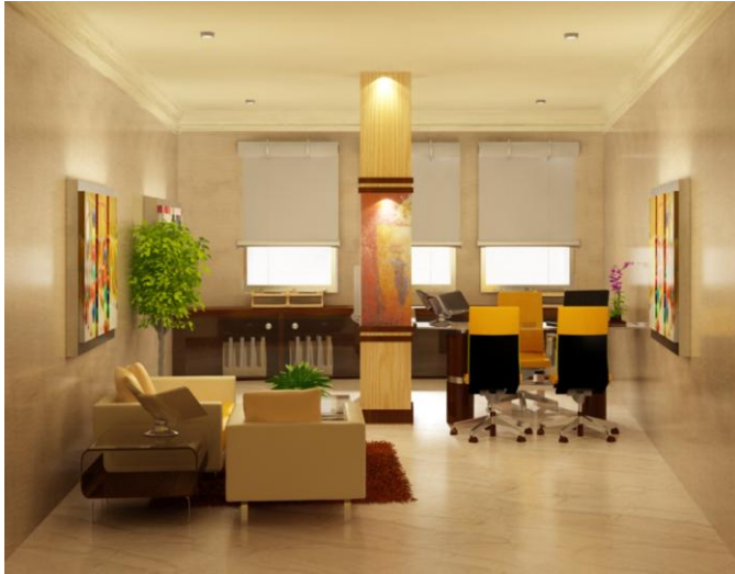
Gambar 3. Ruang kepala sekolah Montessori School

Ruang kepala sekolah berbatasan dengan ruang administrasi, ruang rapat dan perpustakaan. Hal tersebut bertujuan untuk memudahkan kepala sekolah untuk beraktivitas setiap harinya. Ruang yang didesain dengan formal ini didominasi dengan penggunaan warna-warna netral sehingga berkesan bersih dan rapi [7] . Dilengkapi dengan area penerimaan sehingga para tamu dapat merasakan atmosfer yang cukup santai dan tetap serius dalam ruang ini ketika sedang bertemu dengan kepala sekolah.