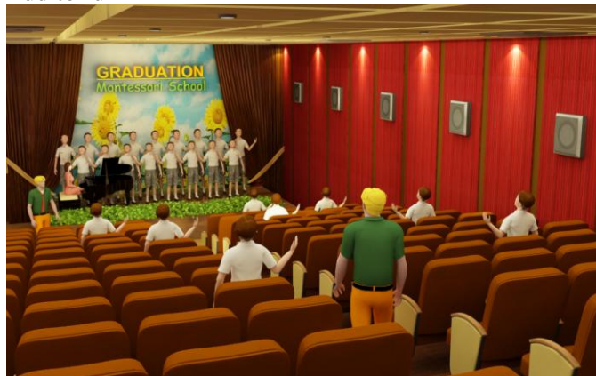
Gambar 14. Auditorium Montessori School

Auditorium dengan kapasitas 120 orang ini menjadi fasilitas penunjang di sekolah Montessori. Mengingat pentingnya interaksi sosial antar individu, maka sekolah Montessori mengadakan beberapa event yang diselenggarakan di area ini. Auditorium dilengkapi dengan sistem akustik sehingga tidak ada bunyi yang mengganggu area lainnya. Dilengkapi pula dengan backstage area yang difungsikan sebagai tempat bersiap-siap para siswa sebelum naik ke atas panggung.