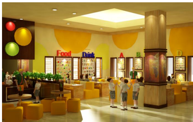
Gambar 13. Area makan Montessori School

tidak digunakan pada tempat yang telah disediakan. Dengan demikian siswa dilatih untuk mandiri dan bertanggung jawab terhadap dirinya sendiri. Penggunaan warna cerah seperti orange dan kuning mendominasi area kantin ini. Secara psikologis, warna orange dipercaya mampu menambah nafsu makan sehingga diaplikasikan ke beberapa bagian di area ini.