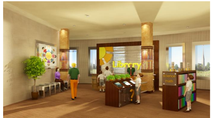
Gambar 5. Perpustakaan Montessori School

Warna netral juga mendominasi berbagai elemen interior dan perabot yang digunakan dalam perpustakaan ini. Demi menjaga ketenangan, karpet menjadi pilihan dari penggunaan material penutup lantai di ruang ini.