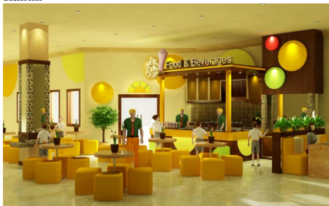
Gambar 11. Serving area Montessori School

Kantin pada sekolah ini dibagi menjadi beberapa area. Area utama adalah area serving dimana para siswa akan menerima jatah makanan yang telah disediakan ketika jam istirahat. Di daerah area serving juga terdapat beberapa meja dan kursi makan yang didesain moveable mengingat area serving juga digunakan sebagai tempat kegiatan belajar memasak oleh para siswa untuk waktu tertentu.