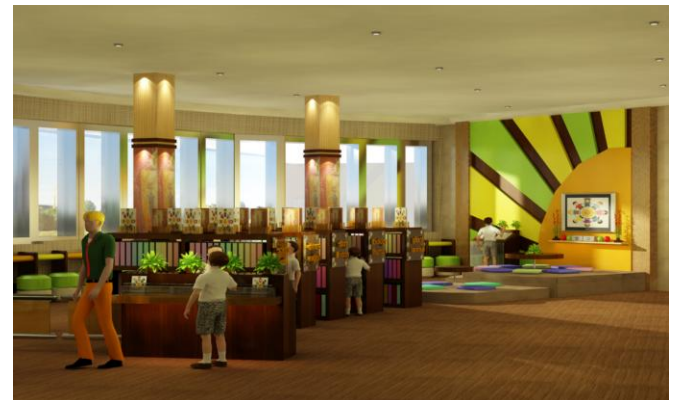
Gambar 6. Perpustakaan Montessori School

Area perpustakaan juga dilengkapi dengan area penerimaan yang berdekatan dengan loker para siswa. Kolom yang terdapat di tengah area juga dimanfaatkan sebagai tempat informasi. Dilengkapi dengan sistem informasi yang cukup canggih seperti Ipad, siswa dapat menemukan berbagai kebutuhannya secara online . Sehingga pengetahuan siswa tidak hanya terbatas pada buku yang telah disediakan. Selain itu, siswa juga dapat mencari buku yang diinginkan dengan lebih mudah melalui search engine yang telah diprogram secara online . Untuk buku bacaan yang lebih up to date , siswa dapat langsung mengetahuinya melalui buku bacaan yang telah diletakkan di atas rak buku, untuk mempermudah para siswa ketika mencari buku tersebut.