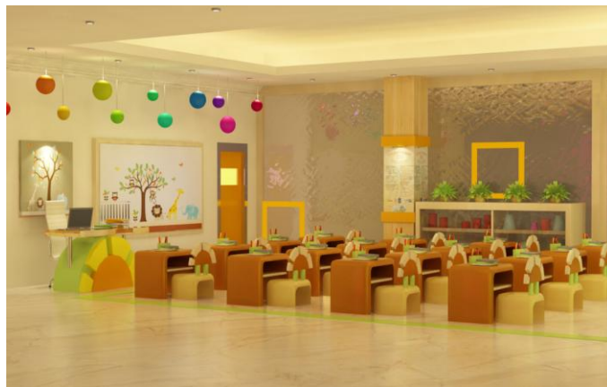
Gambar 8. Ruang kelas 1-3 Montessori School

Desain ruang kelas dibagi menjadi dua yaitu ruang kelas untuk siswa kelas 1-3 dan ruang kelas untuk siswa kelas 4-6. Mengingat metode Montessori merupakan sebuah metode yang dirancang agar anak dapat berkembang secara aktif pada usia awal pertumbuhan, maka ruang kelas siswa kelas 1-3