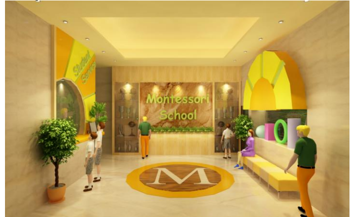
Gambar 2. Lobby Montessori School

Lobby digunakan sebagai tempat informasi, resepsionis, serta ruang tunggu bagi para pengantar. Area ini dilengkapi dengan student performance showcase yang berisi piala dan berbagai penghargaan yang telah dicapai oleh siswa sekolah Montessori. Area lobby dibuat cukup lapang agar para siswa yang sedang menunggu dapat berkumpul dengan tertib di dalam ruang ini. Terdapat beberapa elemen interior menggunakan stilasi dari logo sekolah Montessori yang berbentuk matahari. Diantaranya terdapat area student service dimana area ini menghubungkan antara lobby dengan ruang administrasi sehingga baik orang tua maupun pengantar siswa dapat menanyakan informasi seputar sekolah ini dengan lebih mudah.