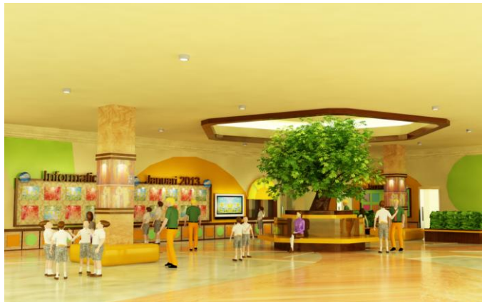
Gambar 7. Main Hall Montessori School

Main hall menjadi emphasis dari sekolah Montessori ini. Area ini digunakan para siswa untuk berbagai aktivitas seperti bermain dan berkumpul bersama teman pada saat beristirahat. Di tengah area ini, terdapat pohon sintesis yang menjadi focal point . Hal ini bertujuan untuk menumbuhkan rasa peduli pada alam pada para siswa sejak dini. Para siswa juga diajarkan cara bercocok tanam sederhana seperti menanam benih dalam kegiatan practical life , yang hasilnya ditempatkan dalam pot kecil dan diletakkan di bawah pohon tersebut. Selain itu untuk beberapa kegiatan tertentu, area ini juga difungsikan sedemikian rupa sehingga menunjang kegiatan belajar mengajar dengan menggunakan metode Montessori.