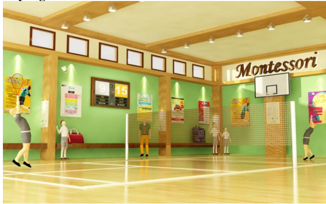
Gambar 15. Lapangan Indoor Montessori School

Lapangan indoor yang berbatasan dengan pintu belakang ini sering digunakan para siswa untuk berolahraga ketika cuaca di luar tidak mendukung siswa untuk beraktivitas pada jam olahraga. Lantai pada lapangan indoor ini menggunakan lantai parket karena lantai parket dinilai lebih enak dibandingkan dengan material penutup lantai lainnya sehingga lebih aman untuk digunakan demi alasan keamanan. Selain itu lantai parket juga tidak licin sehingga cocok untuk diaplikasikan ke dalam lapangan ini. Dinding di area ini juga dijadikan sebagai media pengumuman dan informasi kepada para siswa berkaitan dengan dunia olahraga. Area ini juga dilengkapi area storage untuk menyimpan berbagai peralatan olahraga yang dibutuhkan.