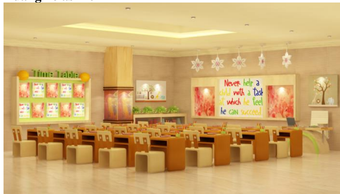
Gambar 10. Ruang kelas 4-6 Montessori School

Berbeda dengan ruang kelas untuk siswa kelas 1-3 ruang kelas 4-6 didesain lebih formal yang dapat dilihat dari penggunaan warna yang lebih netral dan tidak terlalu banyak memiliki pernik-pernik. Selain itu ruang kelas ini juga tidak