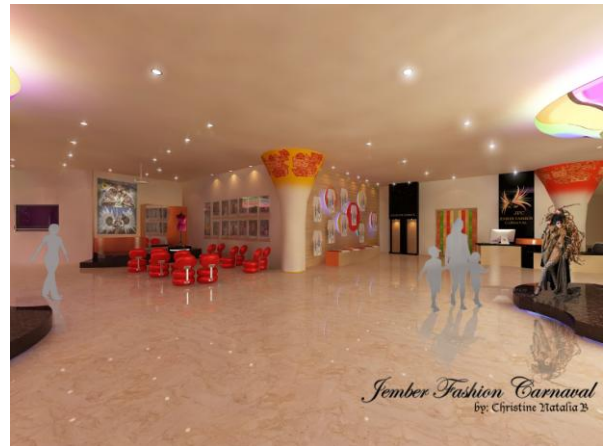
Gambar 9. Area Rias