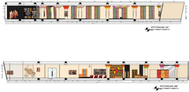
Gambar 4. Potongan

Galeri ini memiliki beberapa area dengan menggunakan open plan, supaya pengunjung dapat menikmati karya-karya JFC tanpa harus terhalang oleh pembatas. Area tersebut antara lain: area best costume , area unique costume , area next costume , sovenir shop , studio foto JFC, area sejarah, area demo, area galeri foto, area profil dan penghargaan.