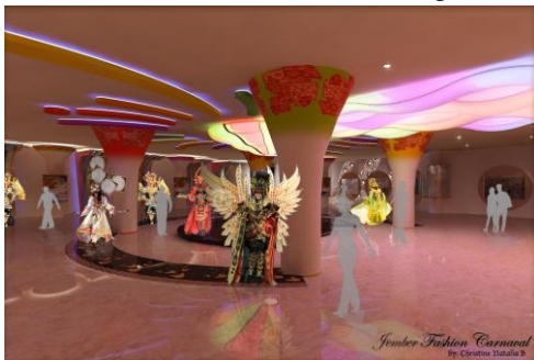
Gambar 6. Perspektif

Galeri yang didesain khusus untuk JFC mrnggunakan bentuk khas dari JFC dan kota Jember, sehingga pada beberapa elemen interior diaplikasikan motif batik yang sudah di stilasi dari bentuk motif batik pada mulanya.