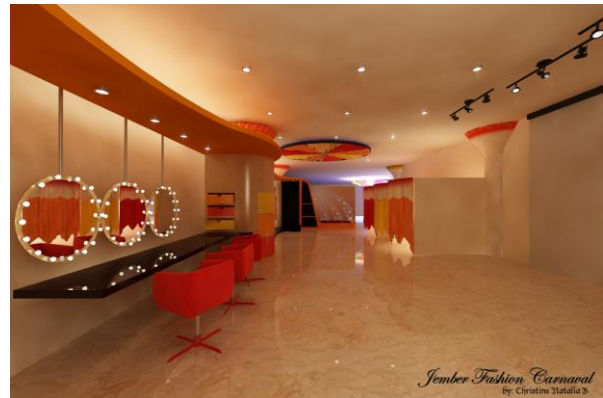
Gambar 8. Area Rias