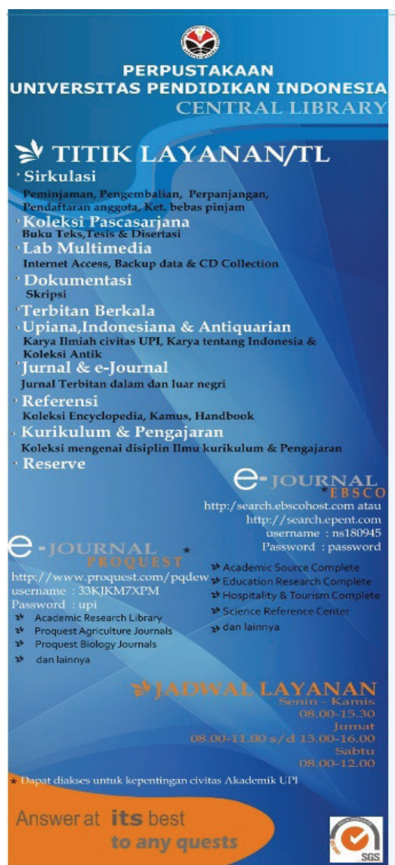
Gambar 1 Tampilan Promosi layanan Perpustakaan UPI menggunakan Xbanner