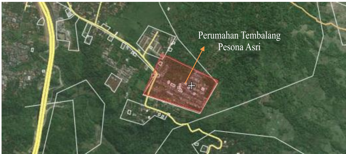
Gambar 1. Peta Perumahan Tembalang Pesona Asri