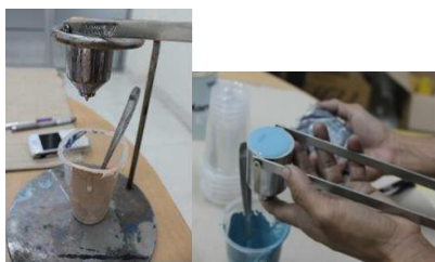
Gambar 1.1 AlatPengujian Daya Kental

Alat ukur yang digunakan ialah: stopwatch ROX ( water resistant ), viscocup NK-2 volume 50 ml (diameter 3.5cm dan 0.5cm), nickel coated copper 350 gram.