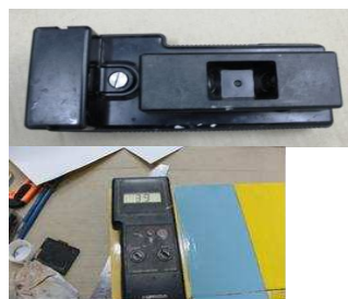
Gambar 1.2 Alat Bantu Pengujian Daya Kilap

Alat bantu yang digunakan ialah Glossmeter (HORRIBA IG-310).