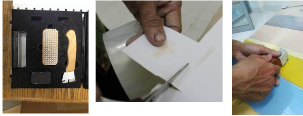
Gambar 1.3 Alat Bantu Pengujian Daya Lekat

Alat yang digunakan pada pengujian ini ialah: Illuminated Loupe (LED) Magnification 40x (diameter 25 mm), Lakban / isolasi besar transparan, Kertas HVS putih / kertas sticker, Crosscut tester 1mm with one blade set magnifier and brush , GARDNER no. 5123.