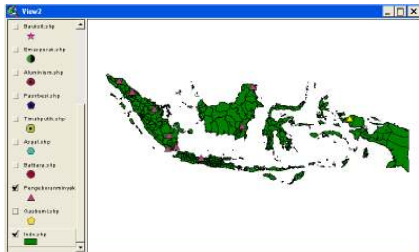
Gambar 4. Peta digital lokasi pengeboran minyak

Peta digital indonesia yang digunakan untuk menampilkan sumber daya alam yang terkandung didalamnya. Salah satu contoh untuk menampilkan pengeboran minyak adalah gambarberikut ini: