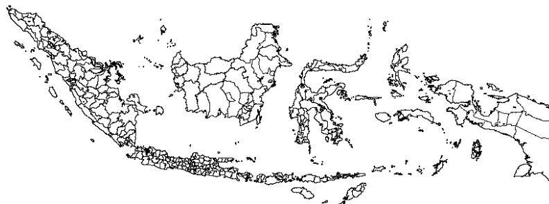
Gambar 1. Peta Indonesia

Perancangan Peta digital Indonesia dapat dilihat pada gambar berikut: