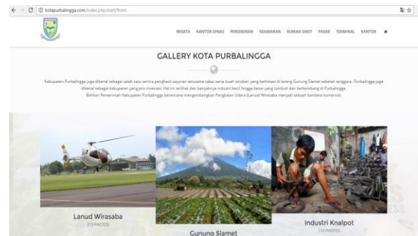
Gambar 5. Implementasi Landing Page

Aplikasi sistem city directory ini mempunyai 2 struktur view yang besar yaitu view untuk landing page dan view untuk halaman inti city directory. Halaman landing page khusus didesain menggunakan HTML5 yang memungkinkan tampilan website bersifat responsif.