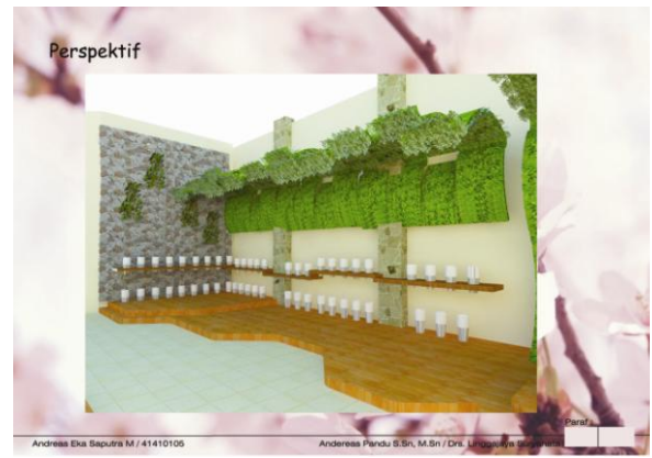
Area Display bunga

Bentukan natural serta penggunaan material bambu dan batu pada main entrance membantu memunculkan kesan natural dan kesan alam yang kuat.