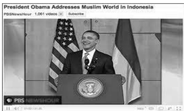
Pidato Rekreatif Barack Obama

Secara teoritis dan praktek yang dilakukan oleh para ahli pidato atau para retor / orator, ada beberapa ciri suatu pidato dianggap baik dan menarik, yakni: