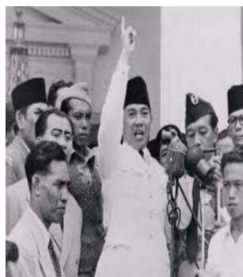
Pidato Persuasif Ir. Soekarno

Merupakan pidato yang tujuan utamanya adalah menyenangkan atau menghibur orang lain. Reaksi yang diinginkan adalah terhiburnya pendengar sehingga muncul suatu kegembiraan. Pidato rekreatif ini biasanya terdapat dalam jamuan-jamuan, pesta-pesta, dan perayaan-perayaan. Adapun contoh pidato rekreatif adalah pidato Presiden Amerika Serikat Barack Obama saat berkunjung ke Jakarta. Pidato Barack Obama tersebut sungguh menghibur dan mampu mengundang tawa pendengar karena saat berpidato, Barack Obama mengucapkan beberapa kalimat menggunakan bahasa Indonesia seperti "Selamat pagi, assalamualaikum, salam sejahtera", "Pulang kampung, nih." Selain itu Barack Obama juga menirukan suara saat memanggil tukang sate yang sering dia lakukan waktu kecil saat bertempat tinggal di Jakarta dulu. Hal itu pun lantas mengundang kekaguman dan gelak tawa bagi para hadirin di tempat Barack Obama pidato tersebut.