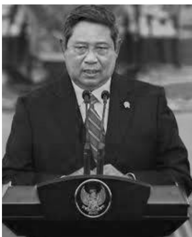
Pidato Informatif Presiden SBY