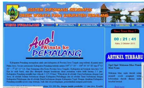
Gambar 3. Tampilan HalamanUtama