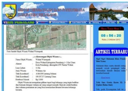
Gambar 5. Tampilan detail menu informasi objek wisata