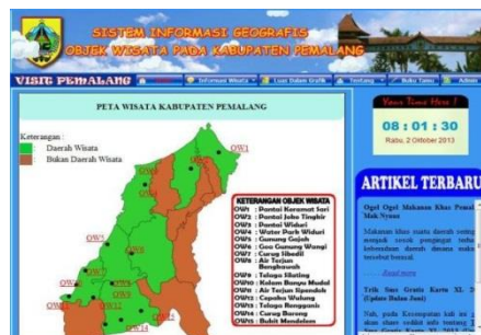
Gambar 4. Tampilan Informasi Objek Wisata