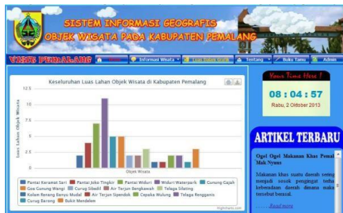
Gambar 6. Tampilan Menu Luas dalam Grafik