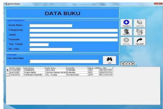
Gambar 5. Tampilan Form Data Buku