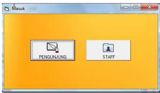
Gambar 2. Tampilan Form Masuk.