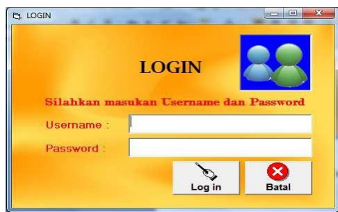
Gambar 3. Tampilan Menu Login