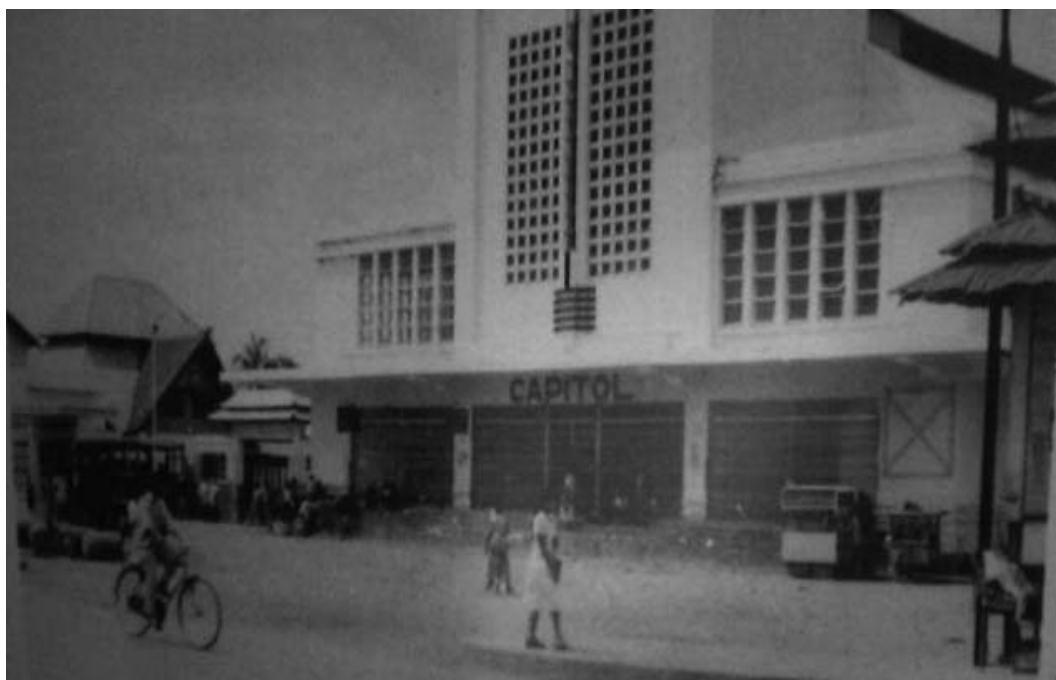
Gambar 1 Bioskop Capitol di Padang (Bioskop Raya)