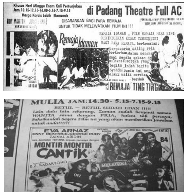
Gambar 6 Iklan Film di Koran

Poster dan reklame film pada masa itu begitu berani menampilkan gambar-gambar yang terlalu ekstrim ditampilkan bila diukur dari adat ketimuran terlebih di wilayah yang kuat adat dan agamanya seperti Padang karena mayoritas adalah masyarakat Minang yang lekat dengan falsafah Adat Basandi Syara', Syara' Basandi Kitabullah. Namun itulah yang terjadi dan telah menjadi sejarah perbioskopian di Padang. Di samping poster dan reklame, trik untuk menarik penonton juga dilakukan melalui iklan di Koran dengan penggunaan gambar-gambar yang mencolok dan bahasa-bahasa iklan yang menarik minat penonton.