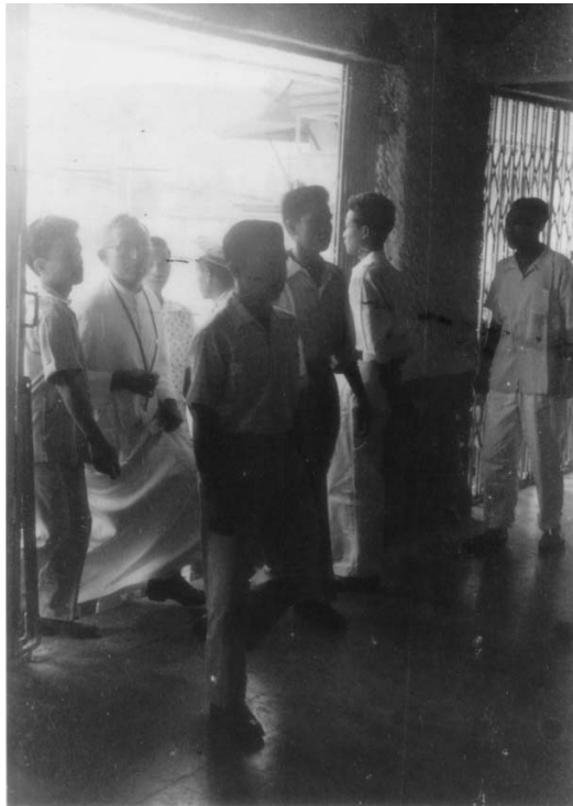
Gambar 3 Penonton Yang Masuk ke Bioskop Raya tahun 1950-an