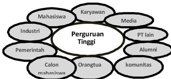
Gambar 1. Pemetaan Stakeholders Perguruan Tinggi

Oleh karena itu, perlu pemetaan terhadap stakeholders yang ada di perguruan tinggi untuk menunjukkan keberagaman pihak-pihak yang berkepentingan terhadap perguruan tinggi. Tentu masing-masing stakeholders memiliki kepentingan yang berbeda, sehingga wajar kiranya jika karakter masing-masing stakeholders pun berbeda.