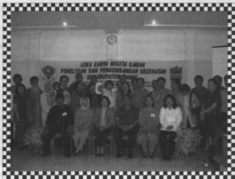
FOTO bersama Peserta & Pejabat di lingkungan Balitbangkes Depkes RI usai mengikuti acara launching Wisata Ilmiah Litbangkes di Loka Litbang P2B2 Ciamis.***

Tlp. ( 0265 ) 639165 - 639187. Fax. 630017