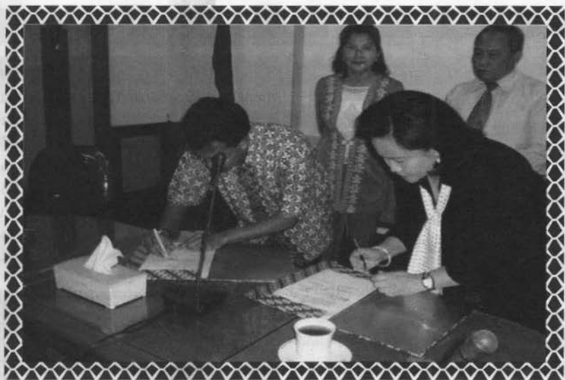
PENANDATANGANAN kerjasama antara Loka Litbang P2B2 Ciamis Balitbangkes Depkes dengan Poltekkes Bandung yang disaksikan oleh Sekretaris Balitbangkes dan PPSDM Depkes.***