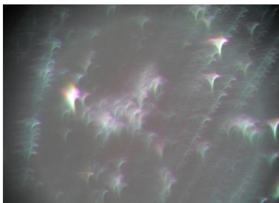
Gambar 2. Bakteri Leptospira sp. yang Mati

Berdasarkan perhitungan didapat kepadatan Leptospira sp. per setiap lapang pandang \pm 500 Leptospira , sedangkan bakteri Leptospira sp. yang tidak tumbuh dan mati tidak dilakukan perhitungan kepadatan.